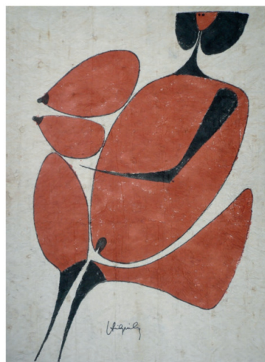
▲ Philippe Hiquily, Retour vers Tahiti . 2008. Peinture sur tapa.