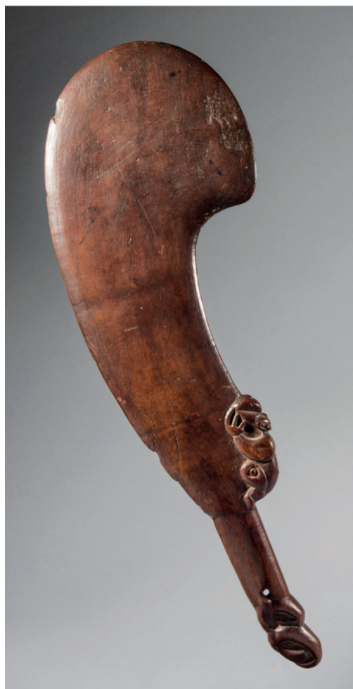
◀ Massue wahaika . Maori ; Nouvelle-Zélande. XVIII e ou début du XIX e siècle. Bois. H. : 44,5 cm. Ex-Hooper, inventaire #H222 ; Christie's Londres, Hawaiian and Maori Art from the James Hooper Collection , 21 juin 1977, lot 77 ; Leo et Lillian Fortess, Hawaï, transmis par descendance ; Christie's Paris, Arts d'Afrique d'Océanie et d'Amérique , 30 octobre 2018, lot 12. Proposée par la galerie Flak, Sur invitation , Paris, 17-21 septembre 2025.