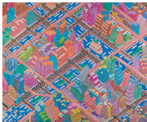
▼ Mamadou Cissé, Welcome to T.D.K City , 2025. Feutre, stylo Bic et gel sur papier. 70 x 100 cm.

► Présentation du concept estival proposé par la galerie Flak en Provence en juillet et août 2026.